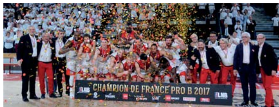
La JL Bourg, Championne de France PRO B 2016/2017

pas cette pourtant très nette impression d'un jeu plus up-tempo. Mais forcément, l'élite dispose tout simplement d'un peu plus de "talents", donc d'adresse. En Pro A, toujours sur 5 saisons, on tire avec 1% de fiabilité en plus (46,5% contre 45,5%), ce qui fait que chaque équipe a besoin de prendre 2 tirs par match de plus pour atteindre cette même moyenne. Ajoutez à cela les balles perdues, elles aussi supérieures (13,6 en Pro A contre presque 15 en moyenne en Pro B), et vous vous retrouvez avec des matches de Pro B qui se jouent sur entre 7 et 8 possessions de plus que dans l'élite. Désolé pour ce petit exposé statistique que, promis, nous ne renouvelerons pas dans les points suivants, mais ces 7,5 possessions de plus par match représentent quand même 5% de jeu en plus. Dont acte.