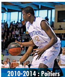
2010-2014 : Poitiers

Déjà, de confirmer en nous qualifiant pour les Playoffs et, pourquoi pas, d'y créer une petite surprise. Même si ici, les trois ou quatre très gros, c'est vraiment fort et pas facile de les battre. Moi, ce qui m'a rassuré aussi, c'est qu'en jouant contre ces équipes d'Euroleague, j'ai senti que je pouvais jouer les pivots qui y évoluent. Contre nous, même ces équipes ont pratiquement tout le temps fait des prises à deux, ce qui veut dire qu'ils me respectent. Et ça, c'est déjà une petite victoire.