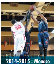
2014-2015 : Monaco