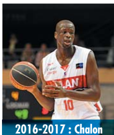
2016-2017 : Chalons