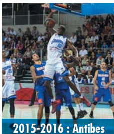
2015-2016 : Antibes